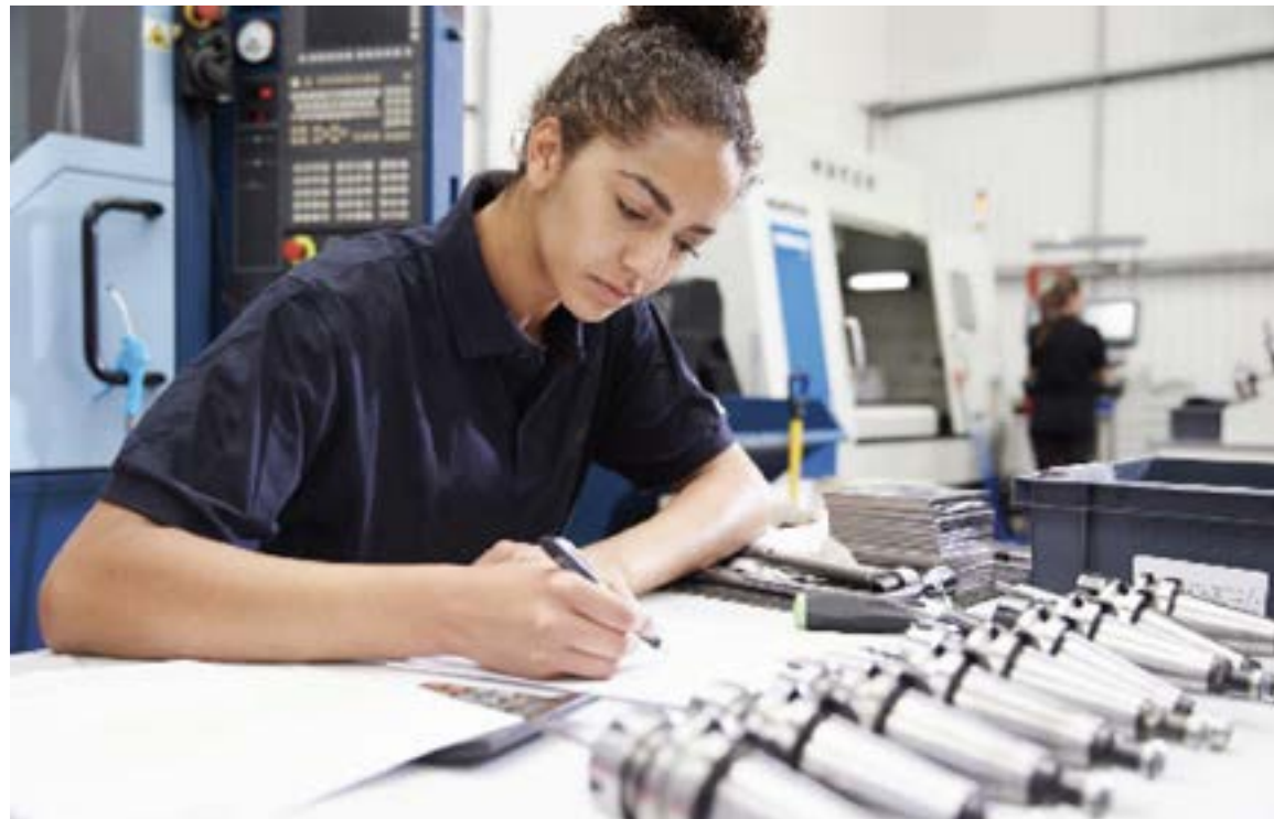
Les professions liées à l'ingénierie sont très prisées, ouvrent d'excellentes perspectives d'évolution de carrière et continueront d'être très recherchées au cours des dix prochaines années.